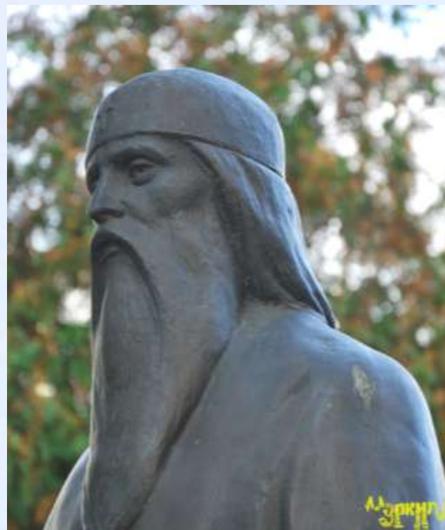
Памятник Нестору летописцу в Киеве.